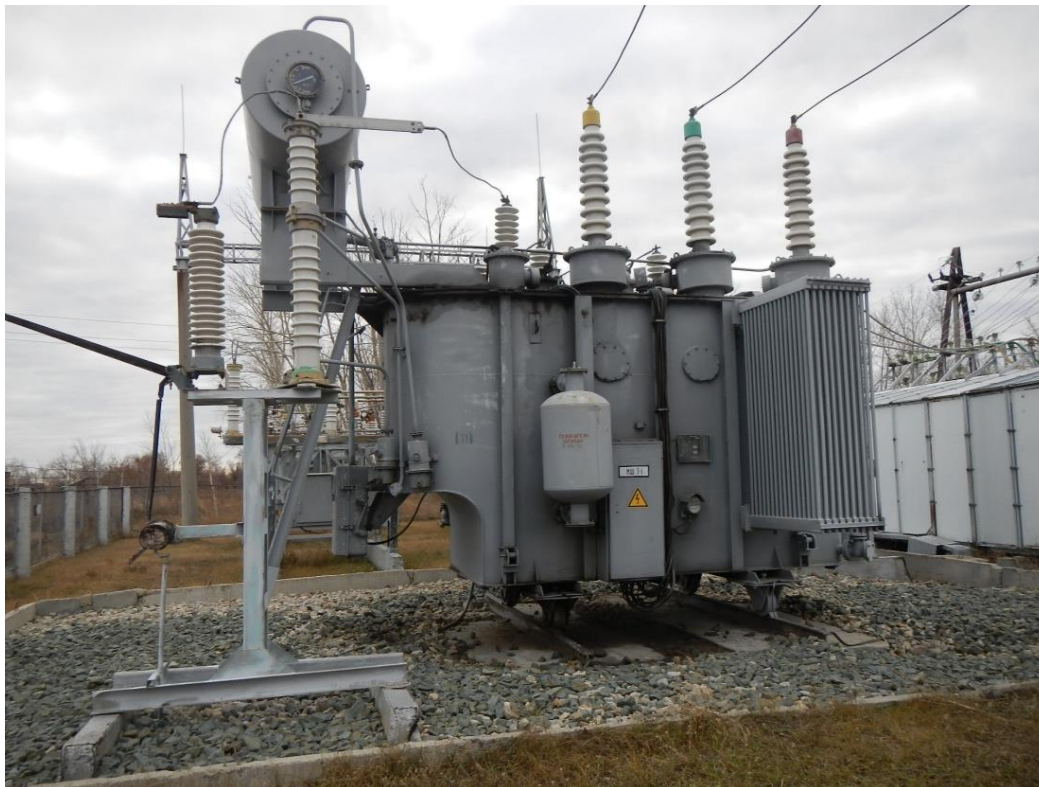
Рисунок 2 - Масляный трансформатор

Несмотря на широкое применение масляного трансформатора, сухой трансформатор пользуется не малым спросом. Сухой трансформатор представляет собой устройство, имеющее между обмотками пространство, которое не заполнено маслом. Благодаря отсутствию масла в баке, трансформатор является безопасным для экологически и пожаробезопасным для окружающей среды.